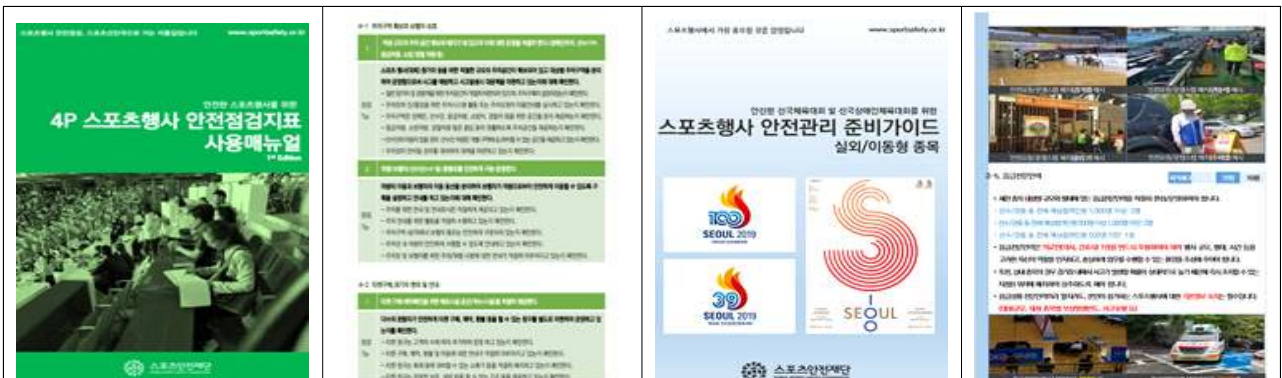
스포츠행사 안전점검지표 사용매뉴얼